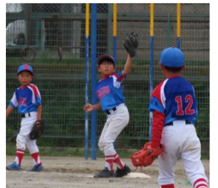
ファーストは守る！

大会や練習試合を経験し少しずつ成長していく子供達の姿を見て嬉しく感じています。スポーツを通して多くのことを一緒に学んでいきましょう。早く優勝したい！！