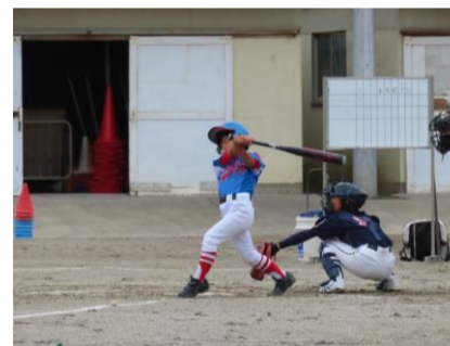
ナイスバッティング！